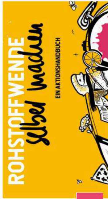
Rohstoffe und Bergbau