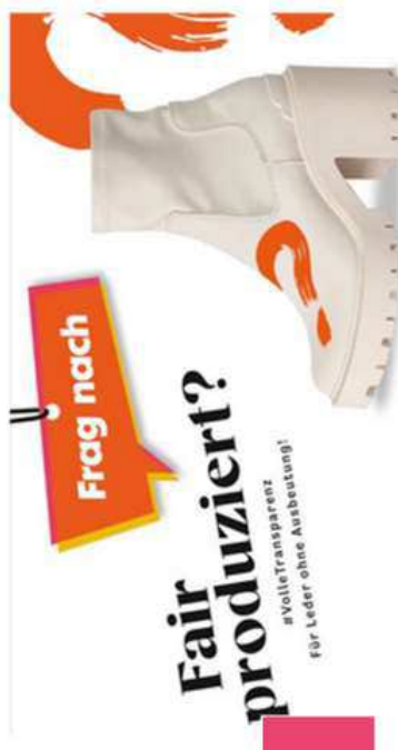
Kleidung und Schuhe