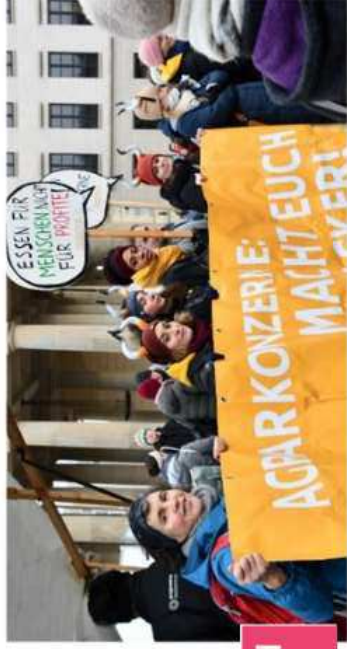
Welternährung und Landwirtschaft