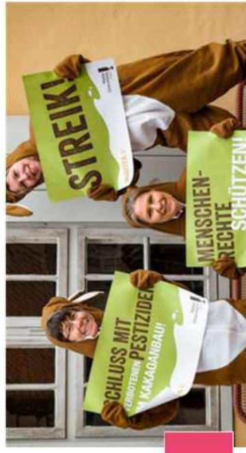
Kakao und Schokolade