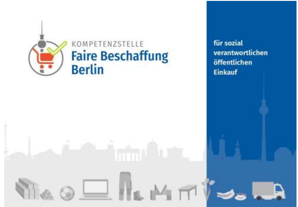
Das Team der Kompetenzstelle